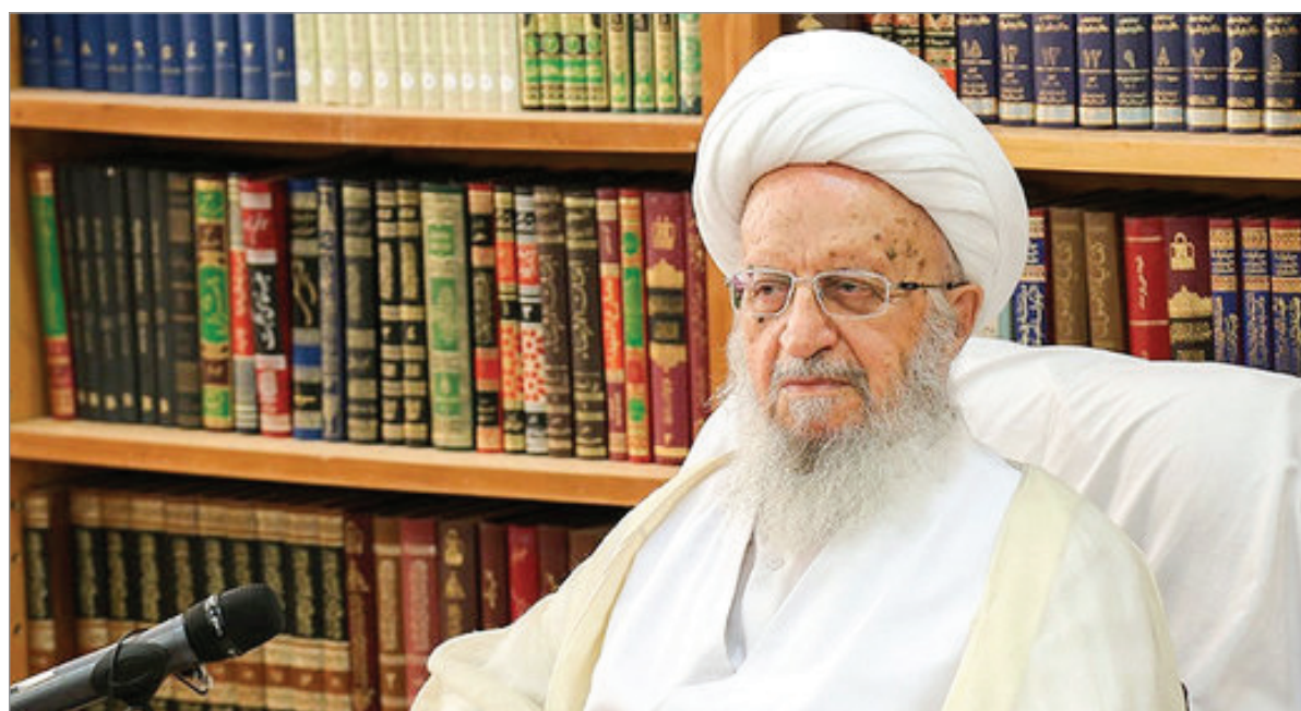
رسالت عالمان دین در پیام آیت‌الله العظمی مکارم شیرازی به دوازدهمین اجلاس سراسری جامعه مدرسین و علمای بلاد

ایشان رضایت‌مندی مردم را وظیفه دیگر علما و حوزه‌های علمیه دانسته و تأکید کردند: مسئولان باید فاصله خود را با مردم کمتر کنند، در دسترس باشند و تلاش کنند تا رضایت آنها را کسب کنند.