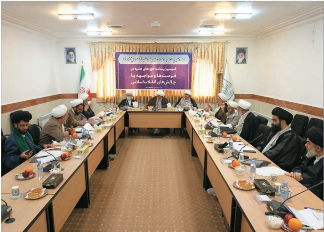
حجت‌الاسلام والمسلمین دیرباز تشریح کرد