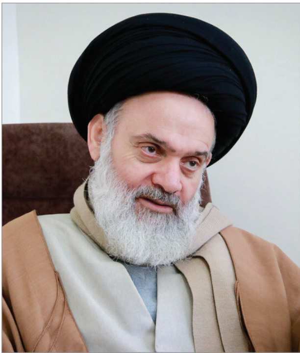
سیماي فرزانه‌گان، ص ۲۵۳

من ابدأ أُخوَد را چیزی نمی‌دانم و در ردیف علمای موجود به شمار نمی‌آورم و آنچه ممکن است مرا به این مقام رسانده باشد این است که هیچ‌گاه از تعظیم و بزرگداشت علماء و نام آنان را به نیکی بردن خودداری ننمودم و هیچ وقت اشتغال به تحصیل را تا آنجا که مقدورم بود ترک نکرده، آن را بر تمام کارها مقدم داشتم.