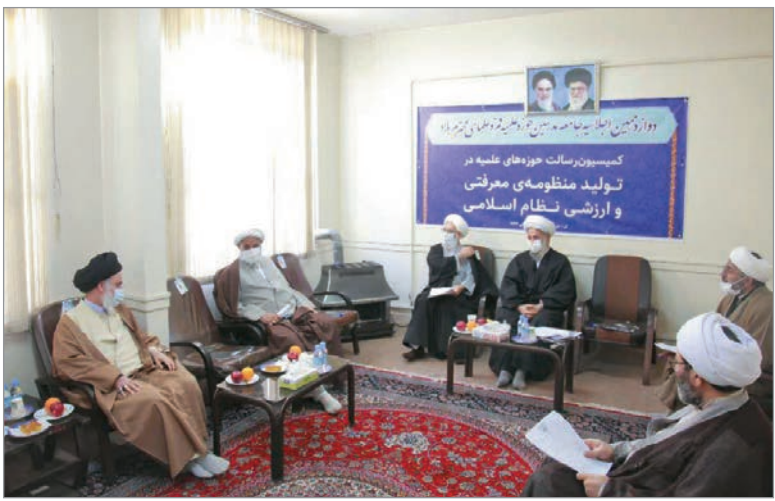
و سندهای ابلاغی از سوی رهبر معظم انقلاب در نشست‌های علمی و پژوهشی را از مهم‌ترین مصوبات «کمیسیون تولید منظومه معرفتی و ارزشی نظام اسلامی» برشمرد.