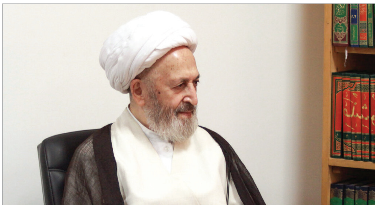
آیت‌الله العظمی سبحانی