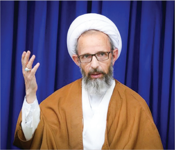
آیت‌الله رجبی عضو جامعه مدرسین حوزه علمیه قم تأکید کرد